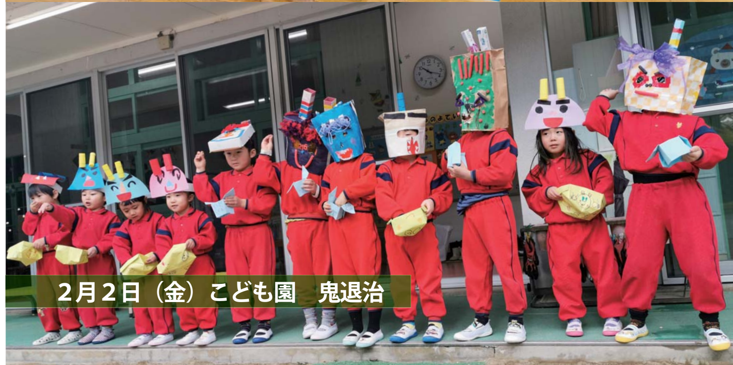
2月2日(金) こども園 鬼退治