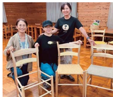
▶グリーンウッドワークでこんな椅子も(左端が本人)