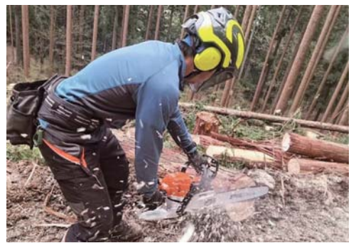
▶たくさん学び、手際もよくなりました

時に危険と隣り合わせの仕事ですが、仲間同士で声を掛け合い、安全確保に努めています。きつい仕事の合間に冗談を言い合える最高の仲間にも恵まれ、充実した日々を送ることができています。