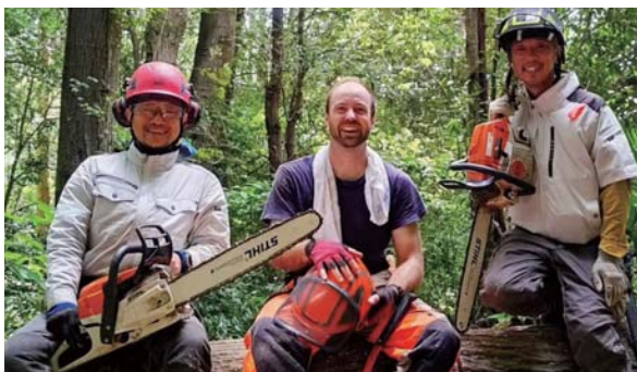
▶最高の仲間たちに恵まれ笑いも絶えません(左端が本人)

林業の仕事でも、たくさん経験を積むことができました。奈良県フォレストアカデミーで学んだと知らないことばかりで、毎日勉強でした。繰り返しすることで徐々に仕事を覚え、出来ることが増えていくのはとても楽しいです。