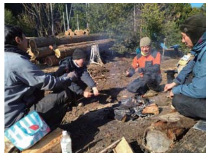
▲真冬の現場では火の温かさが身にしみる。もちろん後片付けは念入りに

森林作業で寒い時期には通常、朝に小さな焚火をし、その日の計画を話し合います。早朝の山に生き物の気配はまれませんが、時々鳥のさえずりが聞こえます。巣を作るキツツキの音も。まだクマに出会っていないこの幸運が続きますように。 いま作業をしている山は少しの雨でも道が滑り、山の強度そのものも危うくなる難所です。ヒノキと杉を伐採しており、4月までに完了したいと考えています。