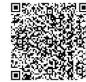
事業者募集について 黒滝村公式ホームページ