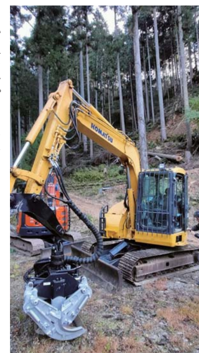
▲大型機械のプロセッサー。丸太をがっちりつかみ、枝を払うなどの作業ができる

私は今回、プロセッサートという大型機械を操作する「特権」を得ました。この機械は伐倒した木をつかんで枝を払い必要な長さに切断でき、作業員を大きな「力」に変えます。イギリスで働いていたとき、よくプロセッサーのため木を倒す仕事をしました。獣のようにパワフルな機械なので、追いつかれないようにする「レース」は本当にハードでした。今は信じられないほど楽しいです。 一日の終わりに山から下り、家のコタツでくつろぎます。平凡な山行きの、ごく普通の一日です。 (ヘンリー・ティリー)