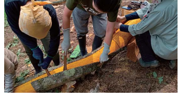
▲外皮をはくと、真っ黄色の内樹皮が現れる

生木を使ったモノづくり「グリーンウッドワーク」の中で、一番複雑なイース作りの研修に隊員2人が参加しています。講習は6月、材料採取から始まりま