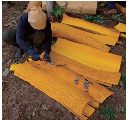
▲丁寧にはいだ内樹皮は、生薬や染料の材料に

生木を使ったモノづくり「グリーンウッドワーク」の中で、一番複雑なイース作りの研修に隊員2人が参加しています。講習は6月、材料採取から始まりま