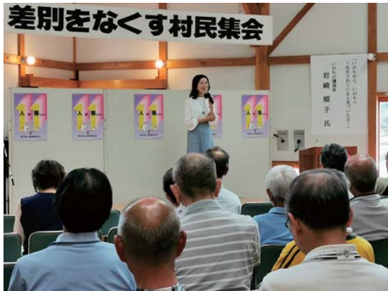
ワンバウンドふらばーる バレー教室開催

自らが経験された夫の死と、その時の子どもたちの様子、自身の心情について赤裸々にお話いただき、命の尊さについて語りかけられるとともに、病气や障がいを持つ方や高齢者などの人の属性にとらわれることなく個人として尊重することの大切さを伝えていただきました。 実体験を経て語りかけられるメッセージは参加者の心に