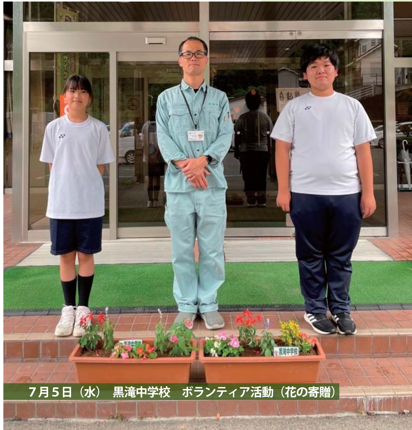
7月5日（水）黒滝中学校 ボランティア活動（花の寄贈）