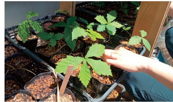
▲昨秋に集めたミズナラとブナの種が芽吹き、すくすくと成長中

昨年から取り組んでいる苗木づくり、この春、芽が出ました。 秋にとったミズナラ・ブナ・クリの種が発芽し、10センチほどになりました。冬の間ずっと静かだったポットの中に、小さな芽を見つけたときはうれしく、思わずいろんな人に言っ