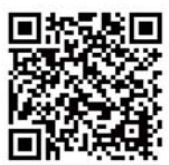
黒滝村ホームページ届出関係

変更点の詳細やご不明点は、林業建設課へお問い合わせいただるか、黒滝村ホームページ(黒滝村WEB)くらしガイド\黒滝村と林業\届出関係)をご覧ください。