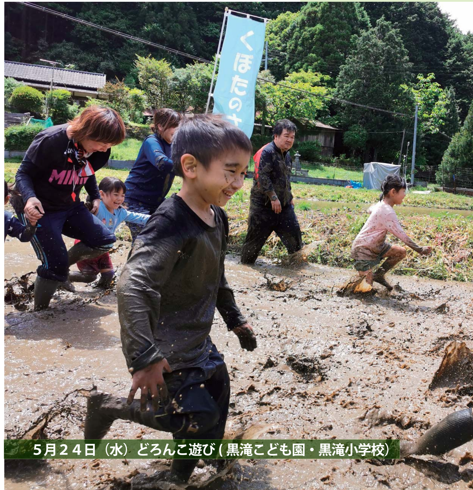
5月24日(水) だろんご遊び(黒滝こども園・黒滝小学校)