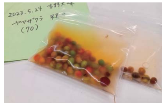
▲今年集めたヤマザクラの実。種をとるため、水につけています

昨年から取り組んでいる苗木づくり、この春、芽が出ました。 秋にとったミズナラ・ブナ・クリの種が発芽し、10センチほどになりました。冬の間ずっと静かだったポットの中に、小さな芽を見つけたときはうれしく、思わずいろんな人に言っ