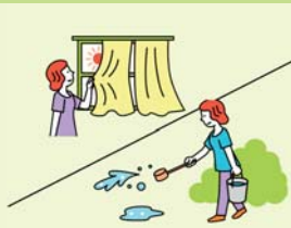
遮光カーテン、すだ れ、打ち水を利用