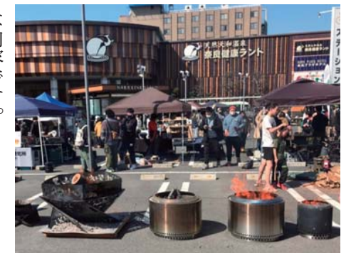
▲焚火をするためのさまざまな道具がずらり

キャンプ好き向けのアウトドアイベントに3月末、協力隊&スギイロとして出店してきました。コロナ禍をきっかけに奈良健康ランド(天理市)駐車場を会場として始まり今回で7回目。市街地でのキャンプはキャンをうたい、参加者が TENTを張って泊まり込んだり大きな焚き火をたいたり、ユニーク