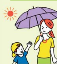
外出時には 日傘や帽子を着用