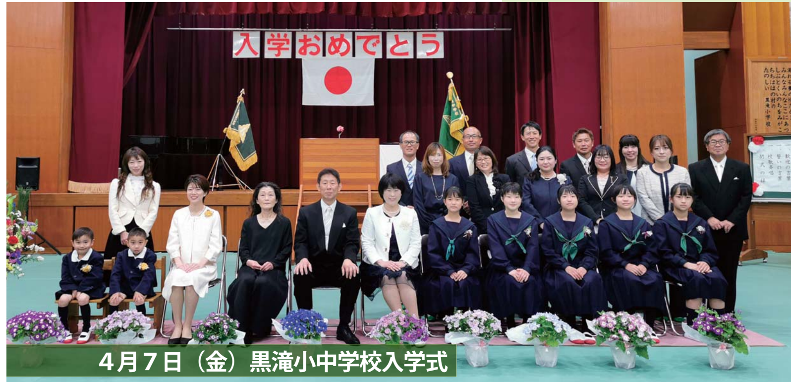
4月7日（金）黒滝小中学校入学式