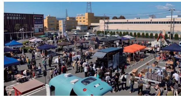
▲会場の駐車場には、泊まり込む人やワークショップ・物販などのテントがぎっしり並びました

キャンプ好き向けのアウトドアイベントに3月末、協力隊&スギイロとして出店してきました。コロナ禍をきっかけに奈良健康ランド(天理市)駐車場を会場として始まり今回で7回目。市街地でのキャンプはキャンをうたい、参加者が TENTを張って泊まり込んだり大きな焚き火をたいたり、ユニーク