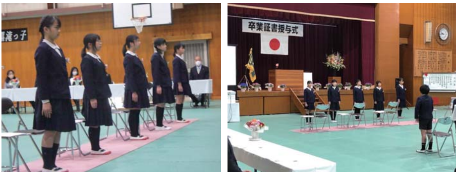
黒滝小学校 第35回卒業証書授与式