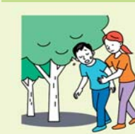
涼しい場所へ避難