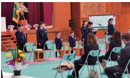
黒滝小学校 第35回入学式 黒滝中学校 第77回入学式

今年、小学校に2名、中学校に5名、こども園に4名の方が入学・入園されました。黒滝小・中学校の入学式では、やや緊張した新入生でしたが、式が始まり、周りの皆さんの温かい雰囲気や緊張がほぐれたのか、笑顔が増え一体感のある式となりました。