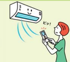
扇風機やエアコンで 温度をこまめに調節