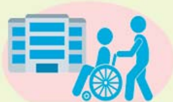
受診時や医療機関・高齢者施設などを訪問する時 混雑した電車・バスに乗車する時