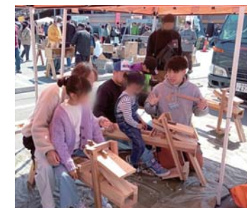
▲生木を使う木工も大好評

行ってみたい」という声を何度も頂きました。たくさんの方に黒滝を知ってもらえ、うれしい一日でした。(酒井みな)