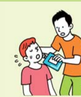
水分・塩分を補給