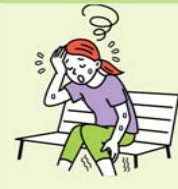
めまい・立ちくらみ こむら返り・筋肉痛 生あくび・大量の発汗