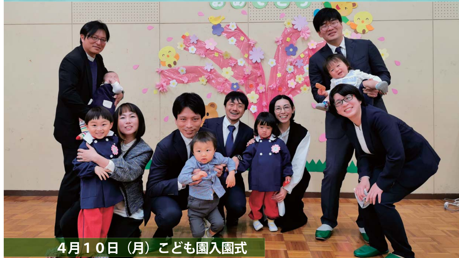
4月10日（月）こども園入園式