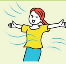
吸湿性・速乾性のある通 気性の良い衣服を着用