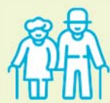
高齢者・基礎疾患を有する方・妊婦 重症化リスクの高い方が感染拡大時に混雑した場所に行く時