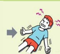
頭痛・嘔吐・虚脱感 集中力低下・倦怠感 判断力低下