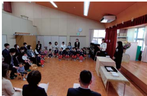
黒滝こども園 第10回入園式

こども園の入園式では、新入園児のこどもたちが、これから始まる楽しい園生活に期待いっぱいの子で、笑顔が溢れる式となりました。