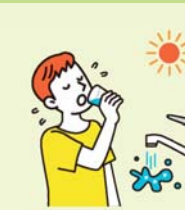
こまめに水分を補給