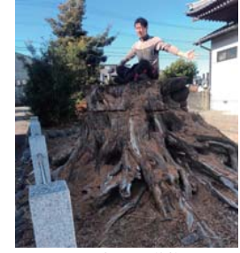
▲この大きさ、複雑さ

黒滝で協力隊が活動を始めて14年。森林組合で山仕事をする隊員が多く、活動を見て頂く機会も限られます。今号から各隊員が普段の作業を紹介する「今月のゲンバ」を始めます。作業の合間の楽しみ、昼ご飯についてのミニコーナー「今月の満腹」もお楽しみに。