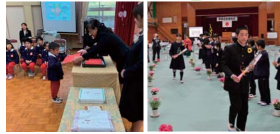
黒滝こども園 修了証書授与式

3月15日に中学校、3月17日にこども園で卒園・卒業式が行われました。今年、中学校4名、こども園2名の方が卒園・卒業されました。皆さまのこれからの更なる活躍を期待しています。