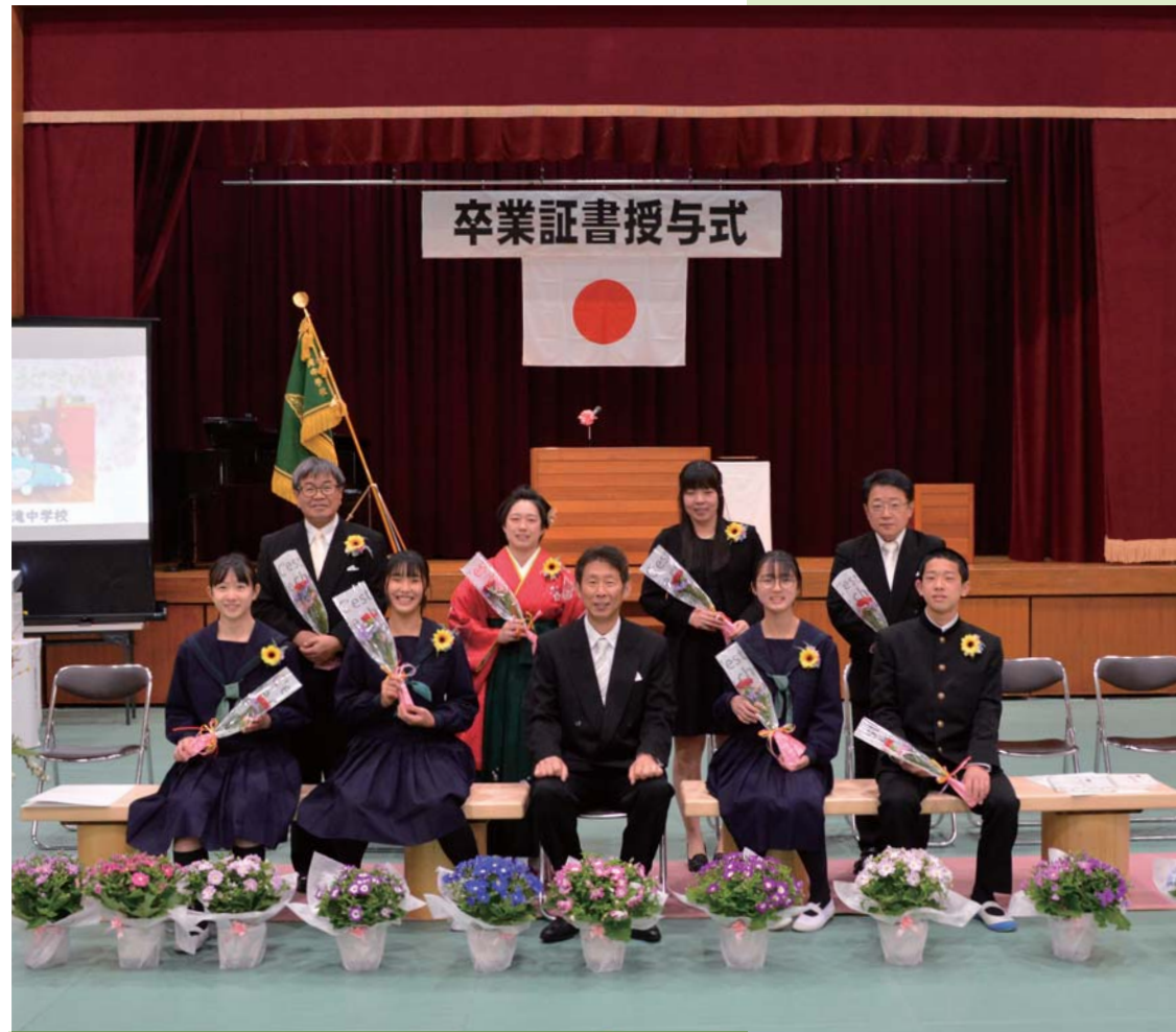
3月15日(水) 黒滝中学校 卒業証書授与式