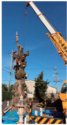
▲特殊クレーンで吊った状態で切っていく

特殊伐採 チーム4人で 2月中旬、泊 りがけで静岡県のお寺へ行って きました。高さ約10mのイヌマ キを伐採し黒滝村へ搬出する仕 事です。 地元の会社にラフターという 特殊なクレーンで吊り上げてもら い、順調に作業。ところが2日 目、根元を切る時にトラブルが。 木に石やコンクリート片がたく さん巻き込まれていたのです。