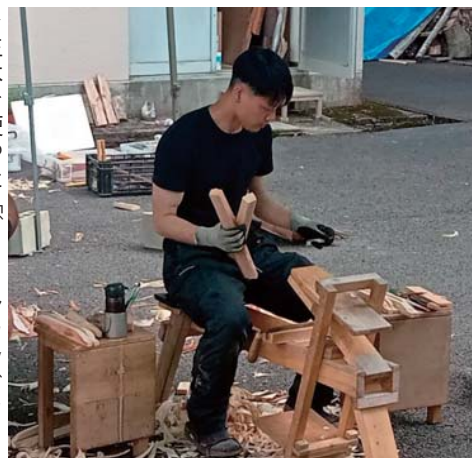
▶生木を使った「グリーンウッドワーク」でモノづくり

色々な方法を模索し、さまざまな場所や方法で販売するなどして、吉野の山と木を知ってもらおう