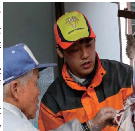
▶わな猟の免許も取得。捕らえた鹿を処理する

間伐で捨て切りした木などを利用してもうためには、建築材以外でも吉野の木を売らないといけません。