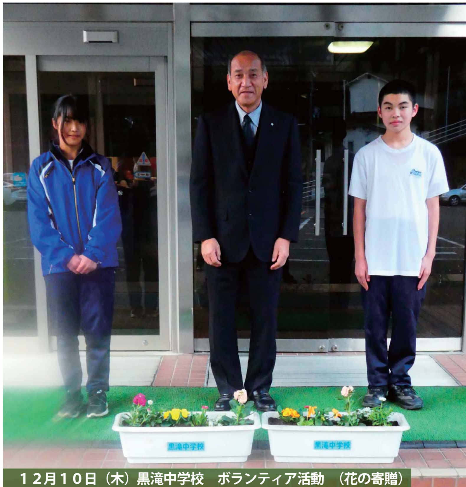
12月10日（木）黒滝中学校 ボランティア活動（花の寄贈）