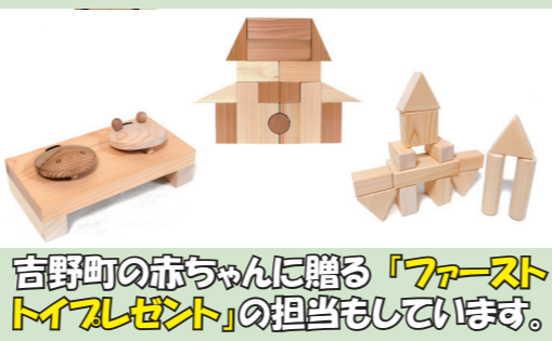
吉野町の赤ちゃんに贈る「ファーストプレゼント」の担当もしています。