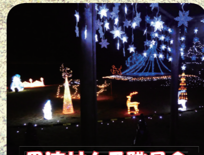
黒滝村女子職員会

イルミネーション in 黒滝村 12月15日～1月8日まで 黒滝・森物語村で開催中!!