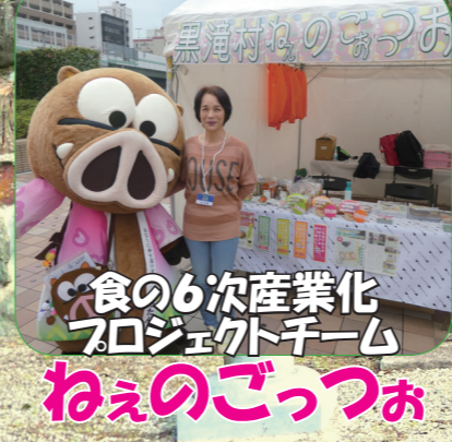
食の6次産業化プロジェクトチーム ねえのごっつお

本誌では取材依頼など村内外を問わず幅広く募集しています。また定期購読ご希望の方にはお送りさせていただきます。 詳しくは地域おこし協力隊白石まで。 お問い合わせ kurotakimuralover@yahoo.co.jp