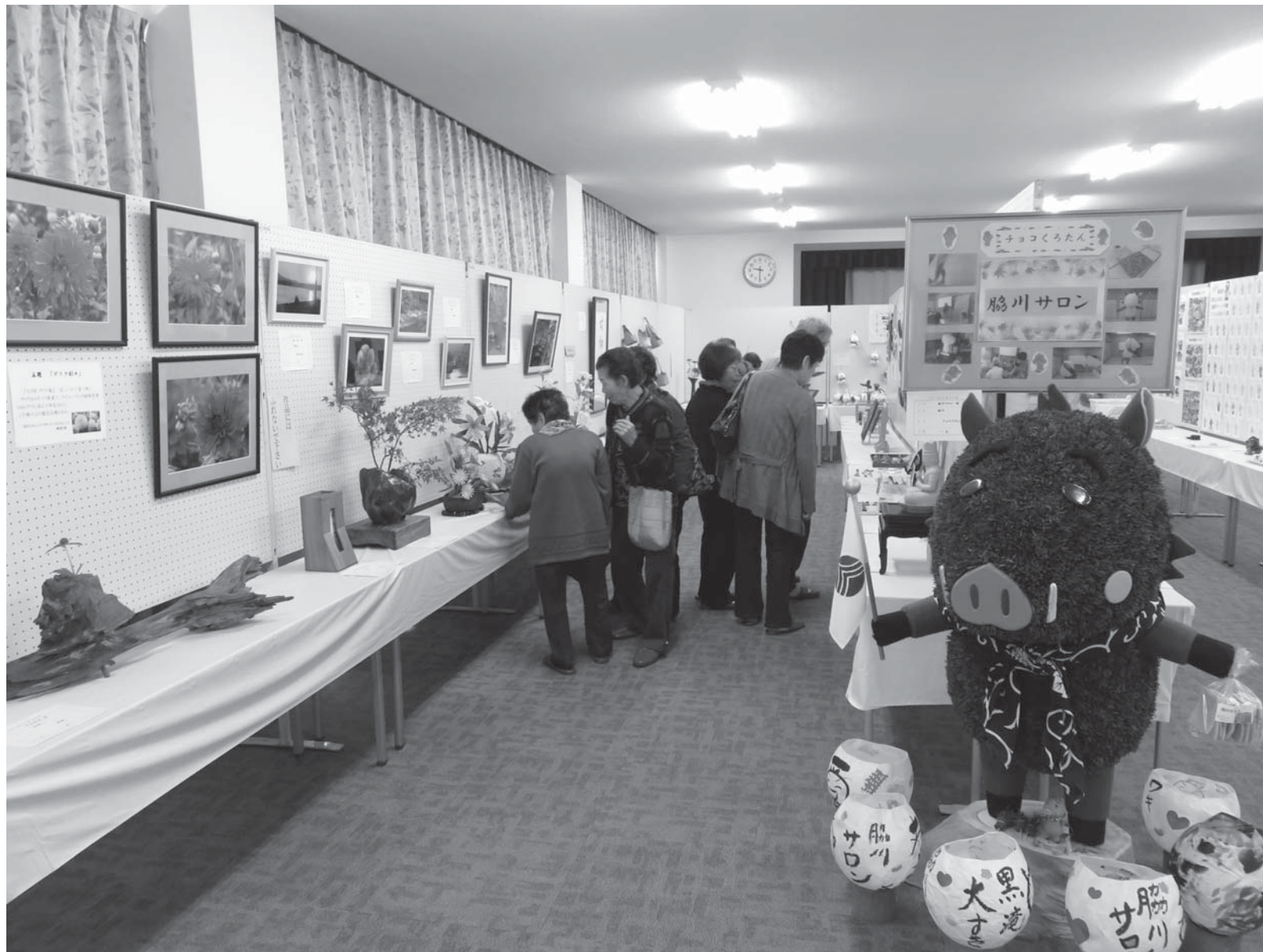
11月10日(金)・11日(土) 黒滝村文化祭【関連記事…P2・P3】