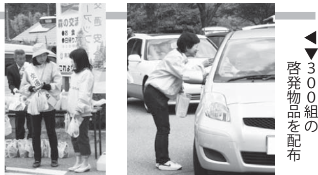
▶300組の啓発物を配布

5月3日(金)、309総合案内センターの駐車場において、黒滝村交通安全協会による「交通安全 新緑キャンペーン」が行われました。黒滝村マスコットキャラクター「くろたん」も応援に駆けつけ、パンフレットや啓発物の配布を行い、運転手に安全運転を呼びかけました。