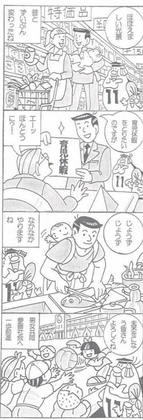
黒滝村人権・同和問題啓発推進本部

毎月11日は【人権を確かめあう日】です 人権とは、人間が幸せに生きていく権利です。すべての人間が生まれながら持っている基本的な権利です。