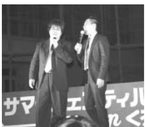
芸人へびいちこの漫才!