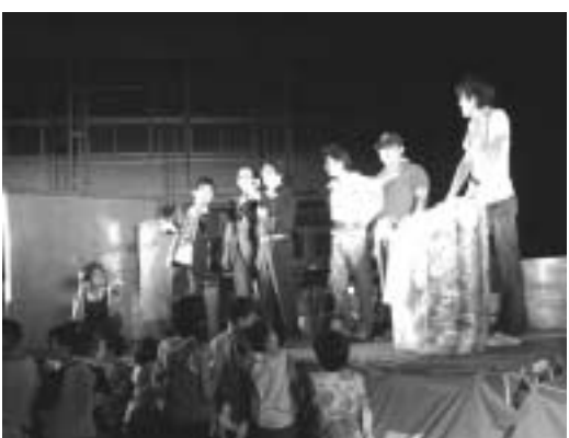
ドキドキの抽選会!

最後にハラハラ!ドキドキ!の抽選会も行われ、楽しいひとときを過ごしました。お盆ということもあり、懐かしい顔ぶれが集まり、夜遅くまで盛り上がりしました。