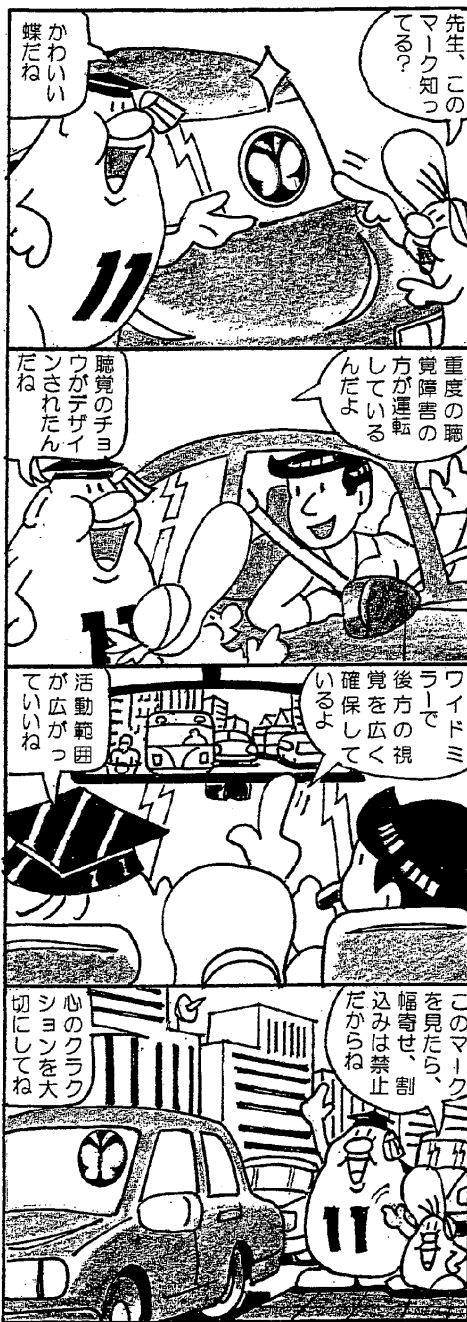
黒滝村人権・同和問題啓発推進本部

毎月11日は『人権を確かめあう日』です 人権とは、人間が幸せに生きていく権利です。 すべての人間が生まれながらに持っている基本的な権利です。