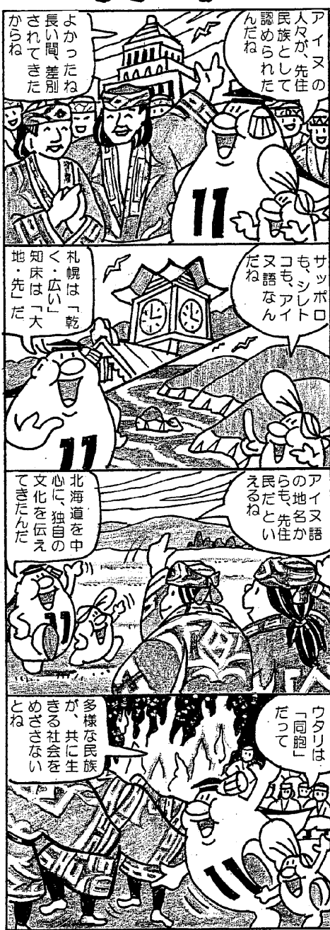
黒滝村人権・同和問題啓発推進本部

毎月11日は『人権を確かめあう日』です。人権とは、人間が幸せに生きていく権利です。すべての人間が生まれながら持っている基本的な権利です。