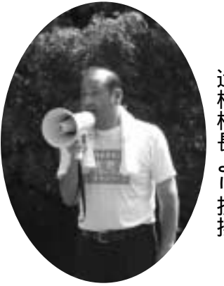
辻村村長より挨拶

毎年の行事として実施されている吉野川マナーアップキャンペーンが本年も、8月5日(日)に黒滝・森物語村周辺の河川で行われました。