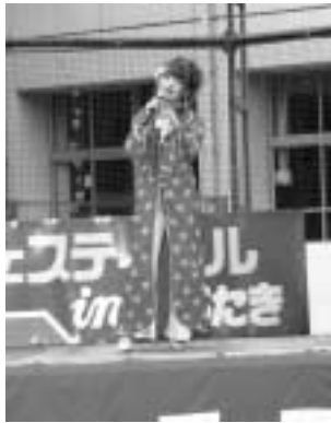
ハヤトの歌謡ショー

8月15日(水)、サマーフェスティバルinくろたきが小学校運動場で行われました。