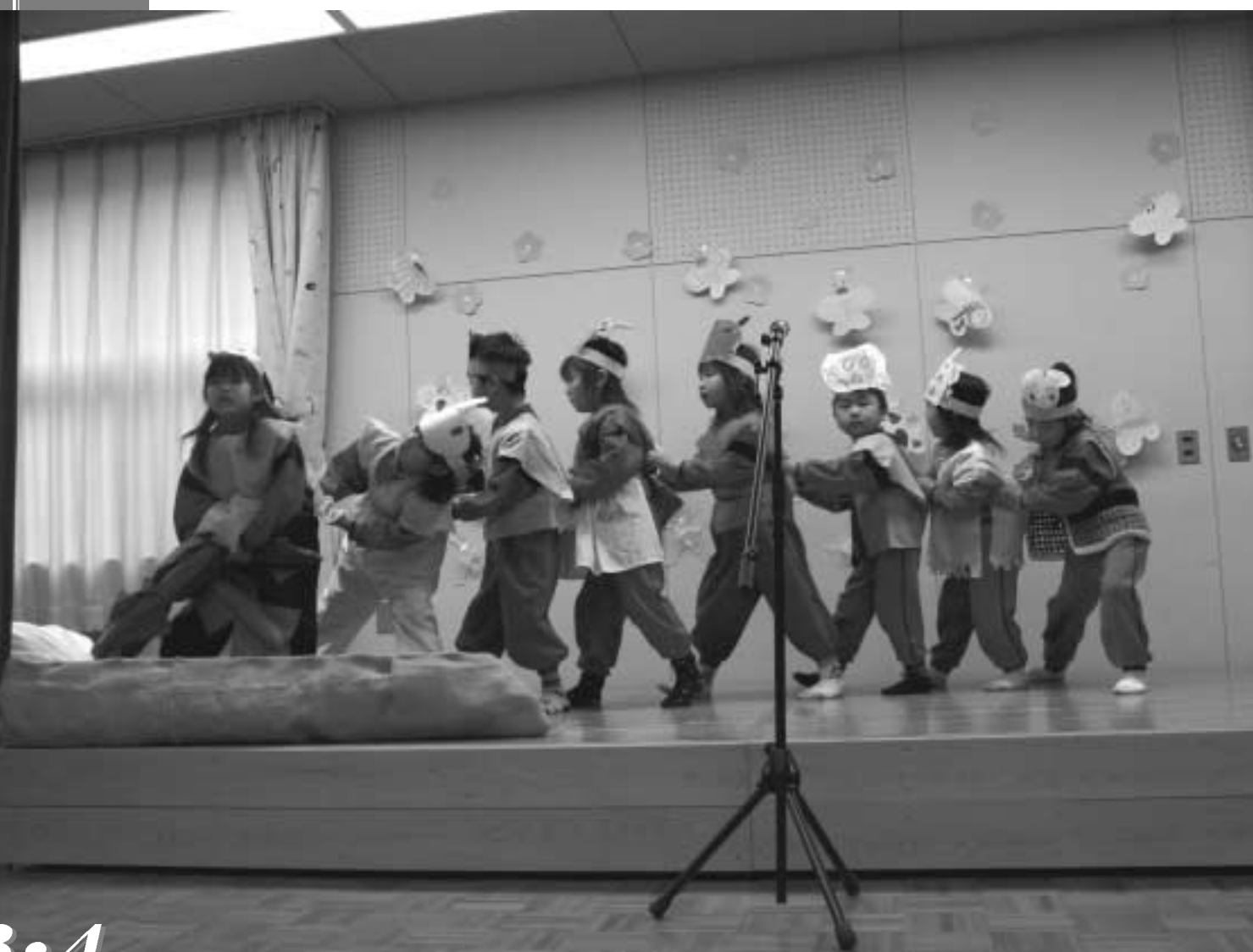
幼稚園【保護者参観】